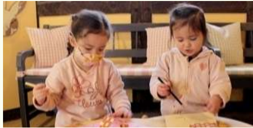
Fun English Activities