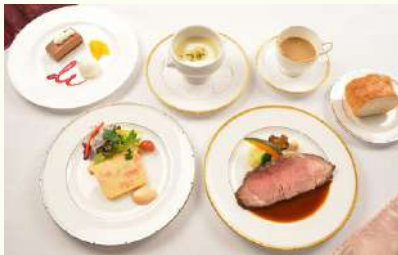
Table Manners in English