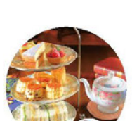
アスコットティールーム