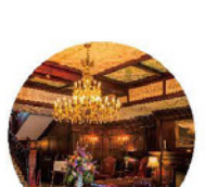
マナーハウスツアー ※事前予約優先