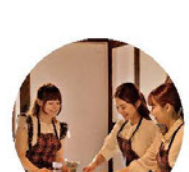
英語カルチャーレッスン ※事前予約優先

パスポートのいらない英国での過ごし方は様々。 英語カルチャーレッスン受講やレストラン、ショッピングだけでも利用可能です。