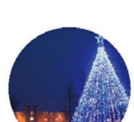
イルミネーション ※宿泊者限定