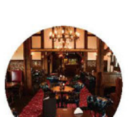
フォルスタッフパブ