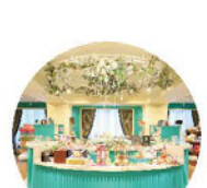
ギフトショップ ビクトリアンアレー