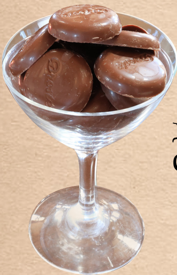
Droste Milk Chocolate