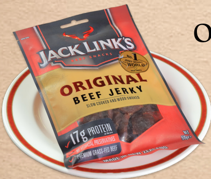
Original Beef Jerky