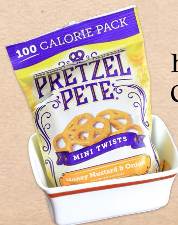
Honey Mustard & Onion Pretzels